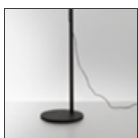
Demetra Reading Floor - floor support opaque black 1741050A