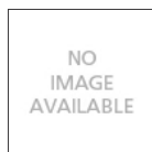
TIZIO NERA SUPPORTO TERRA A087700