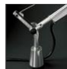
TOLOMEO SUPP.TAVOLO FISSO A004200