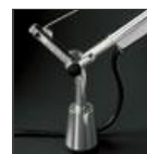
TOLOMEO SUPP.TAVOLO FISSO A004200