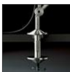
TOLOMEO MORSETTO A004100