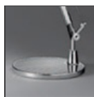
TOLOMEO BASE TV ALL D230 A004030