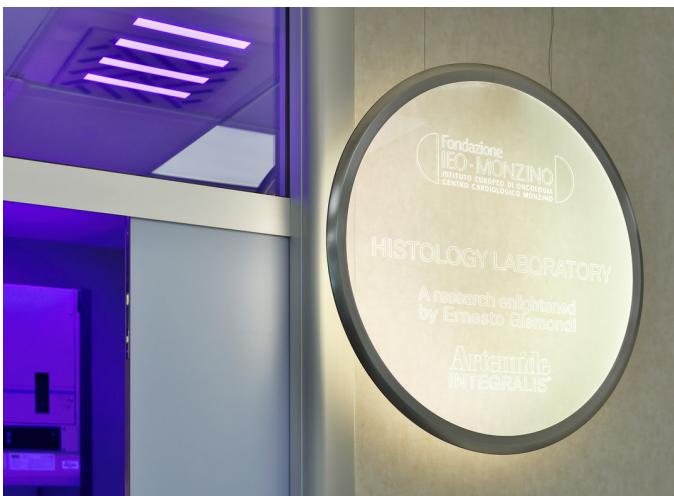
Discovery Special - Ernesto Gismondi | A.39 Diffused Pure Integralis - Carlotta de Bevilacqua

Artemide, in collaborazione con la Fondazione IEO-MONZINO , ha lanciato il progetto "Per una Ricerca Illuminata" per migliorare le condizioni di lavoro e la qualità delle analisi nei laboratori del Centro Cardiologico Monzino. Sono stati illuminati due laboratori, quello di Microscopia e quello di Istologia, con particolare attenzione alle condizioni ambientali, attraverso la riduzione, grazie alla luce, dei microorganismi patogeni.