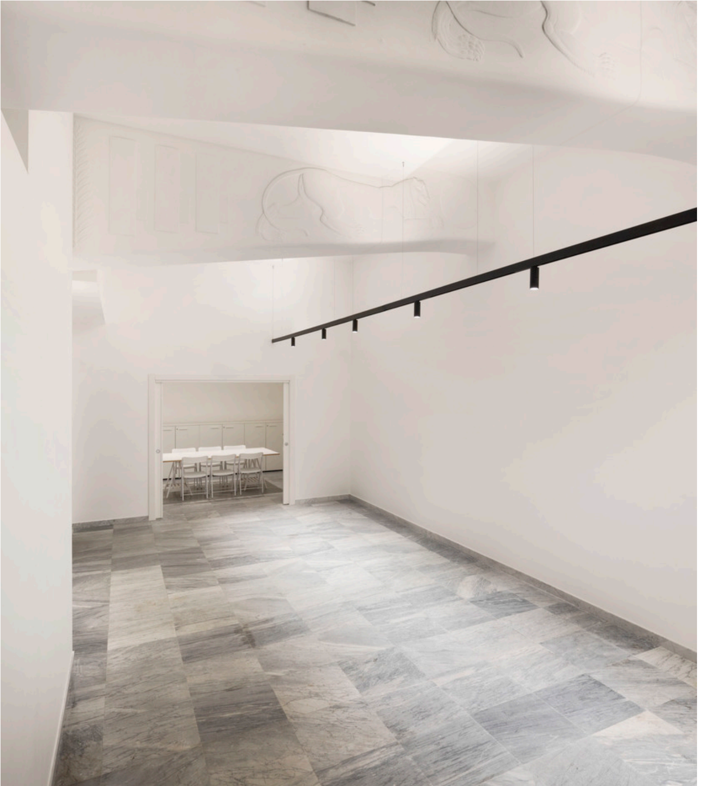
A.24 System + Vector Magnetic - Carlotta de Bevilacqua

A renovation and conservative restoration work that, based on a rich documentation of the archives, has tried to give back to the cinema its original characters.