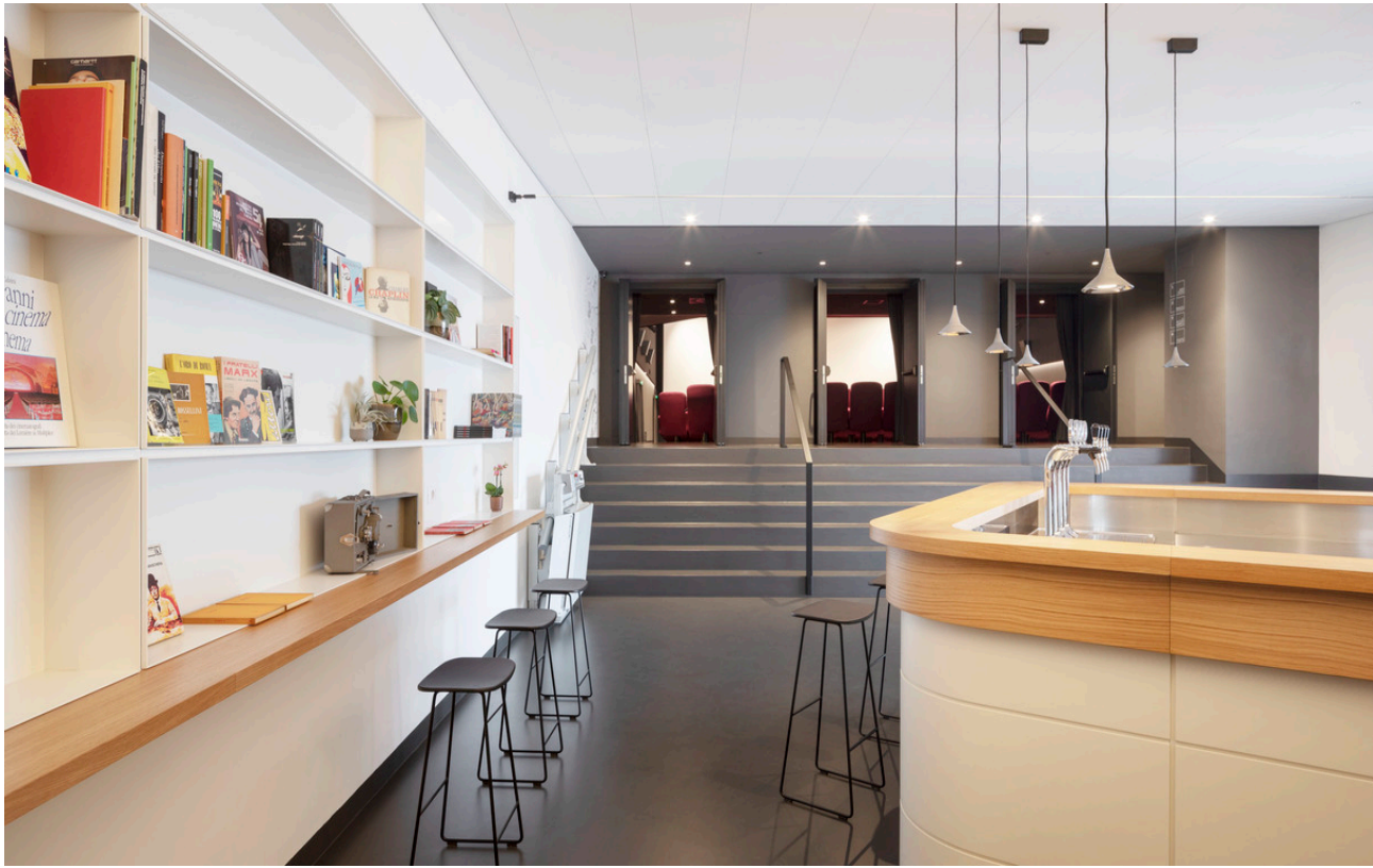
Unterlinden - Herzog & de Meuron