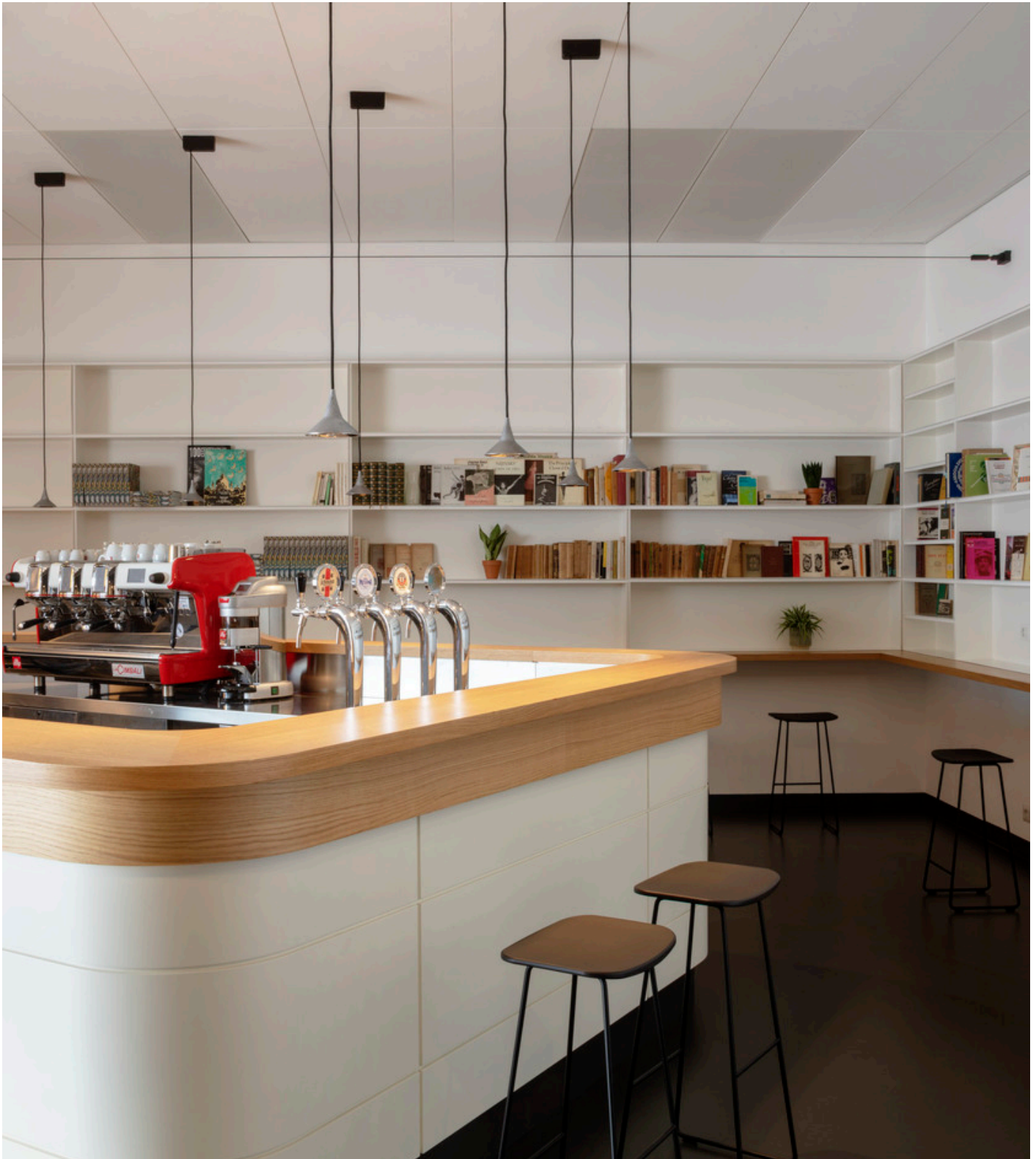
Unterlinden - Herzog & de Meuron

Ospitato all'interno dell'edificio dell'ex GIL, progettato nel 1933 da Luigi Moretti, il Cinema Troisi è uno spazio unico nel panorama europeo: una storica sala cinematografica da 300 posti dotata delle tecnologie di proiezione più all'avanguardia, di un foyer-bar, di una luminosissima terrazza, di uno spazio polifunzionale per mostre ed eventi e di un'aula studio – biblioteca con 80 postazioni, aperta 365 giorni all'anno, 24 ore su 24.