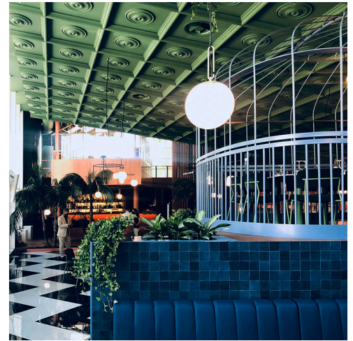
nh 35 Sospensione - Neri&Hu

Nell'ambito della ristrutturazione, il vecchio cinema è utilizzato come un grande spazio simile ad un atrio.