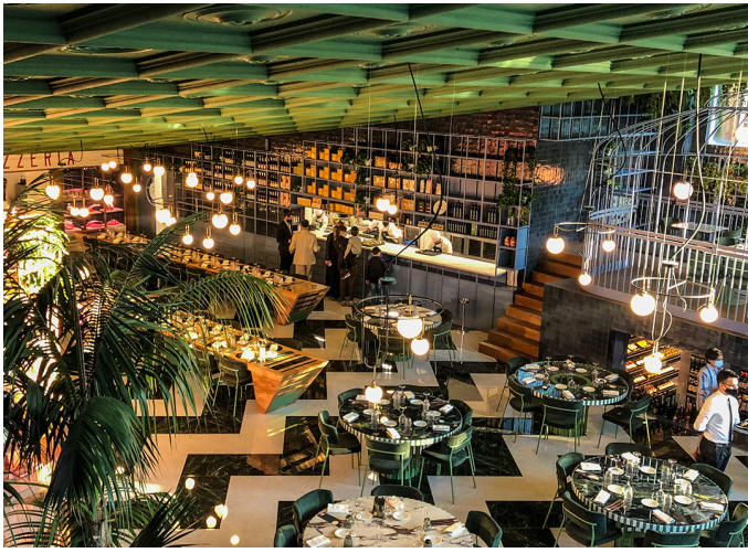
nh - Neri&Hu