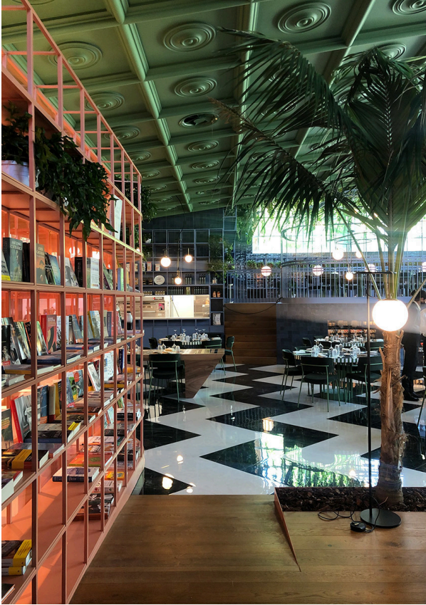
nh S5 Elliptic - Neri&Hu