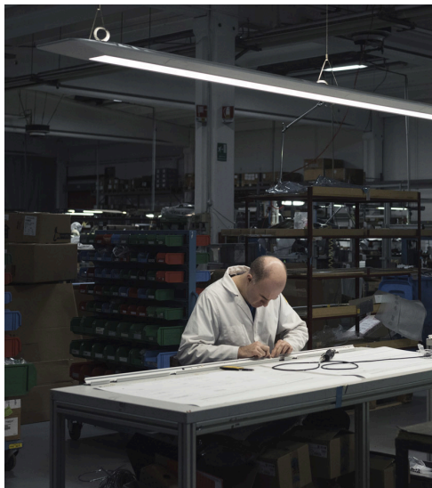
Artemide, Pregnana Milanese

➤ Il concreto impegno di Artemide verso una sostenibilità a 360°, non solo ambientale ma anche sociale, è un percorso che ha portato l'azienda ad essere certificata ISO 9001, ISO 14001 e ISO 45001.