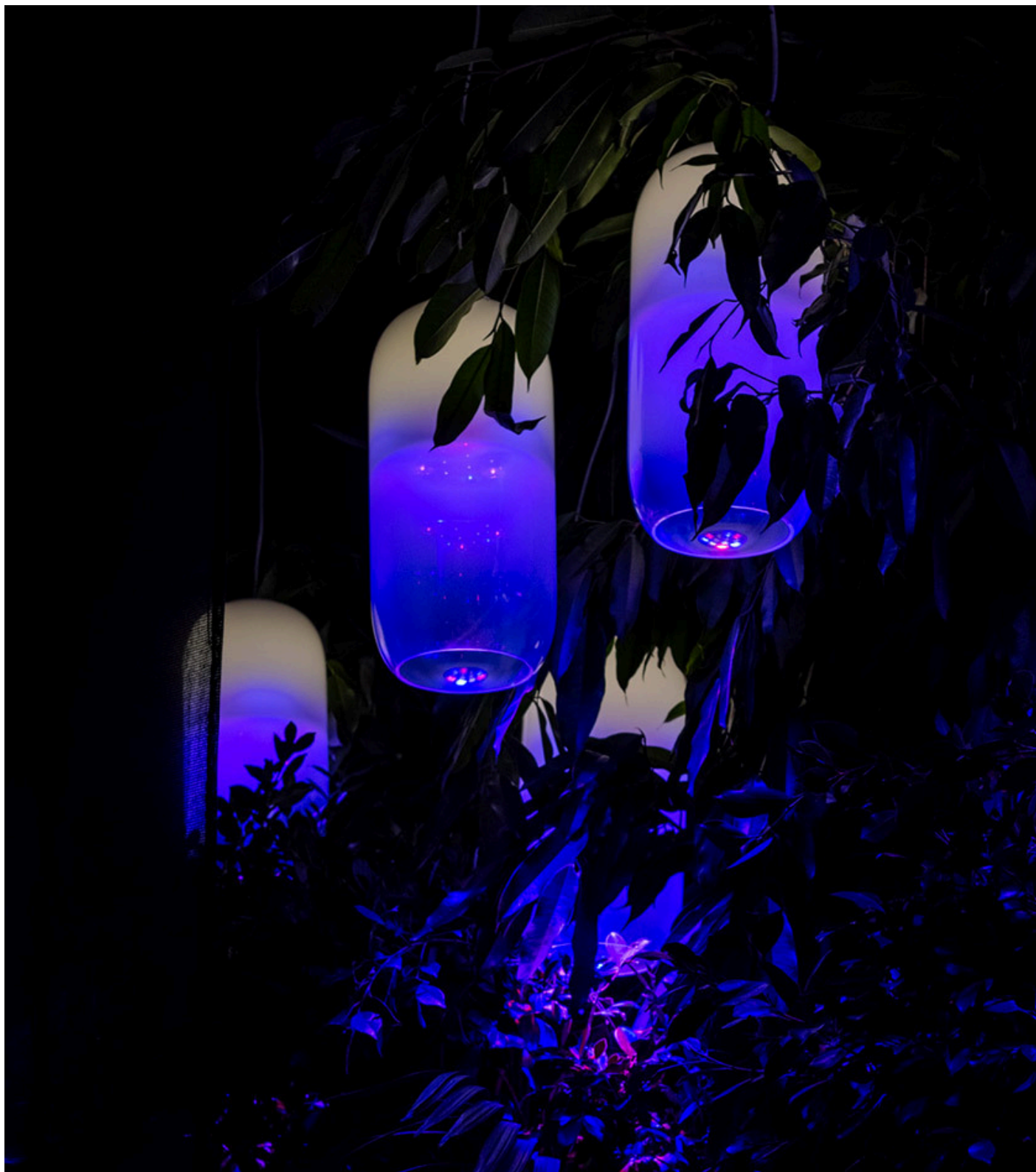
Growing Light - Gople RWB

La luce influisce sul benessere psicologico e fisiologico, nutre la natura ed è anche un mezzo di comunicazione in grado di fornire nuove esperienze ed emozioni per trasformare ogni spazio nel luogo in cui le persone vorrebbero vivere.