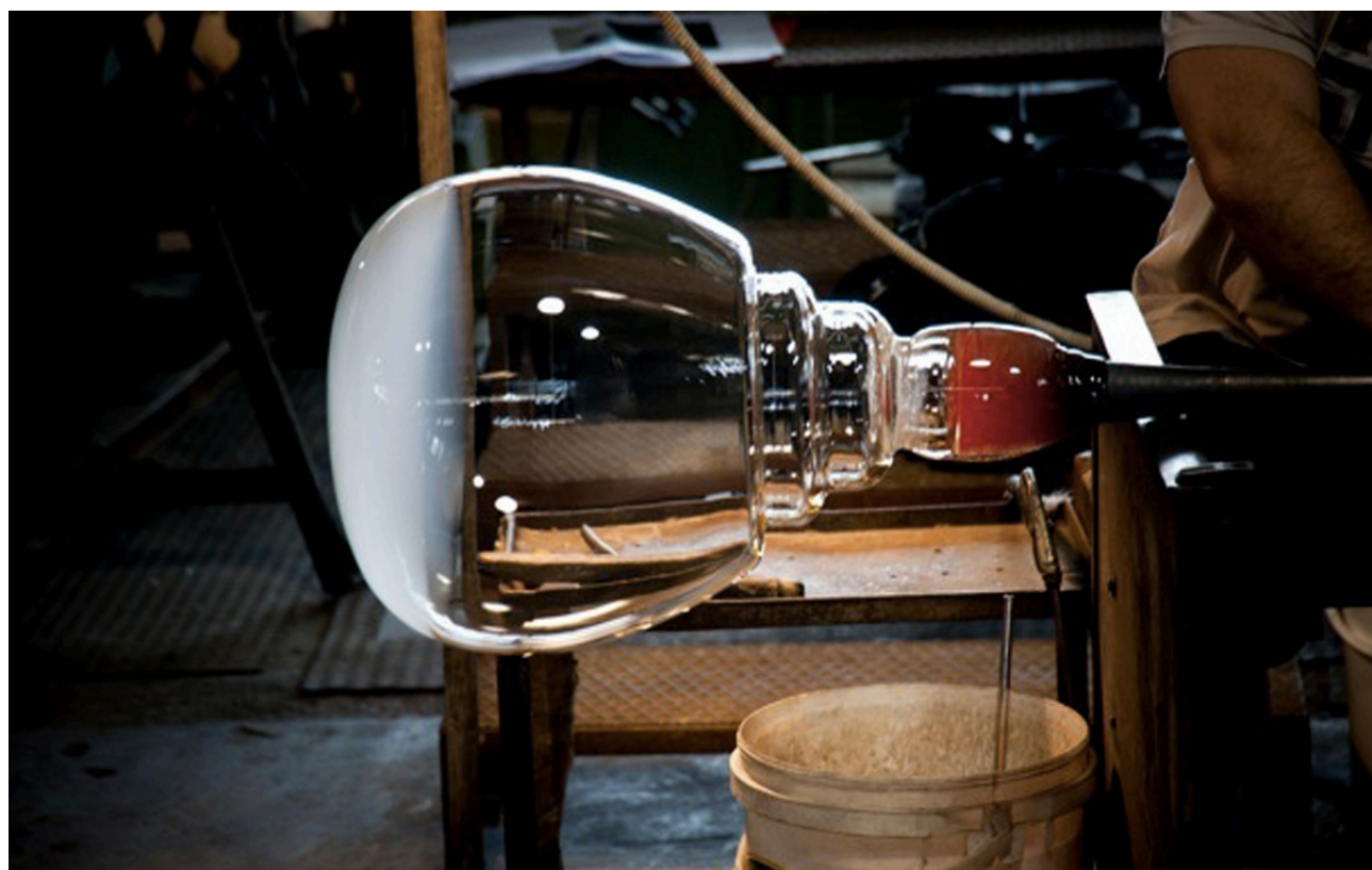
Vetrofond, Glass Workshop