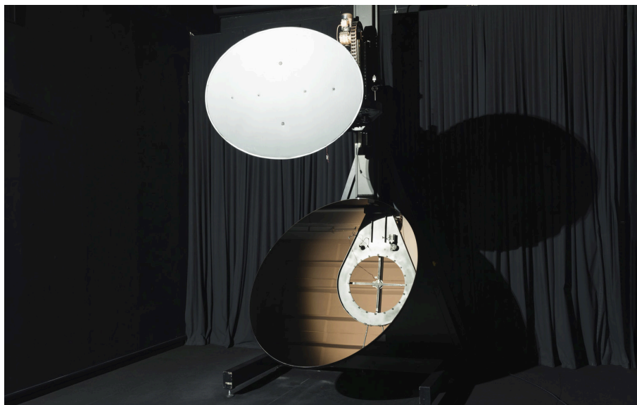
Mirror Photogoniometer, Artemide Ricerca e Sviluppo