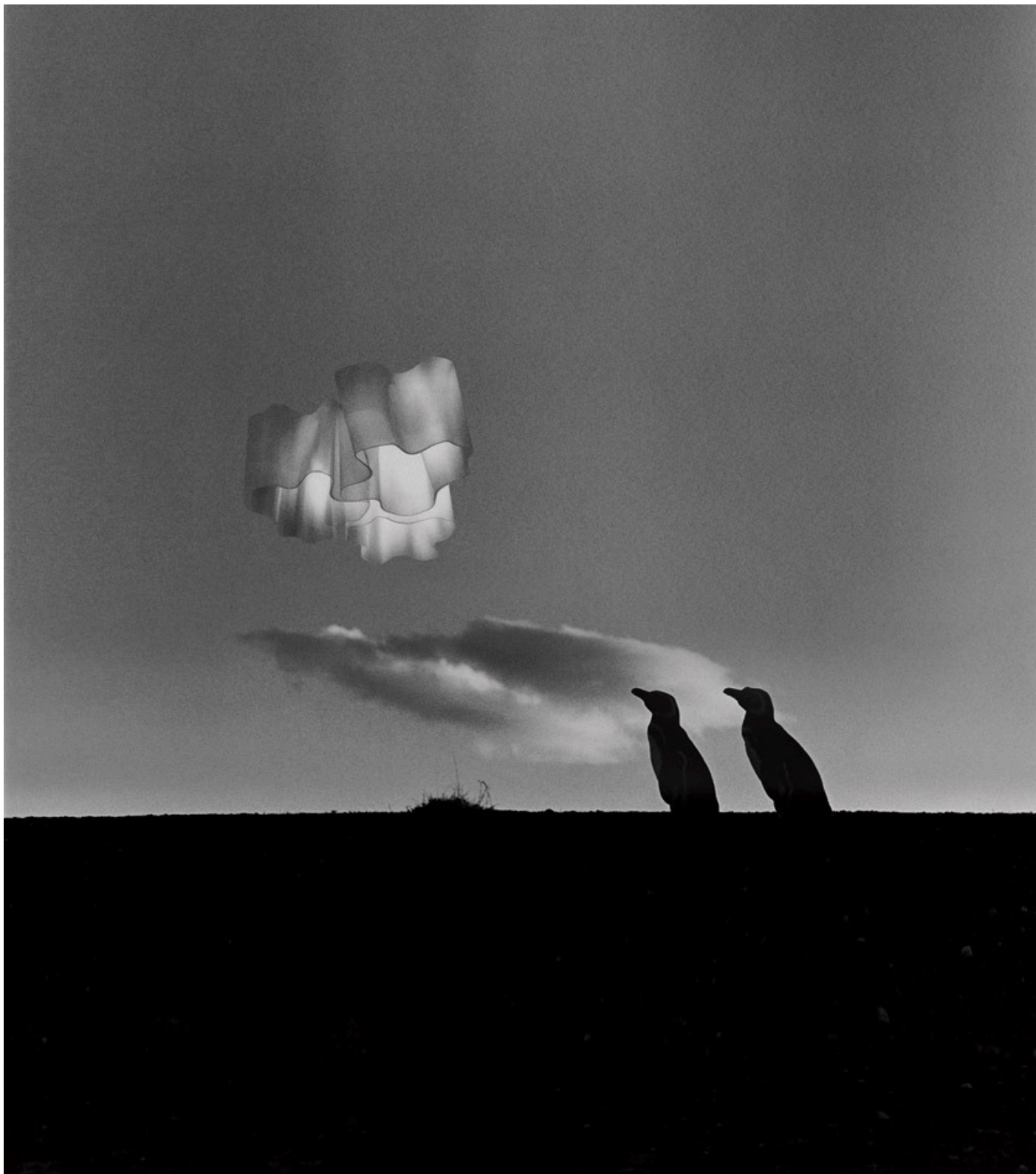
Logico, fotografata da Elliott Erwitt, 2001

Tutta la collezione Artemide è espressione di un design responsabile e attento. È da sempre presente una spinta a sviluppare nuovi prodotti in cui l'attenzione verso l'ambiente sia intrinseca e connaturata nella volontà progettuale. Artemide si impegna in una costante attività di ricerca, nel tentativo di sviluppare sistemi di illuminazione che rappresentino un'alternativa migliore a ciò che già esiste. L'innovazione è guidata da valori e testimoniata da numerosi brevetti di invenzione che, grazie ad un transfer tecnologico estremamente ridotto, sono immediatamente applicati nei prodotti.