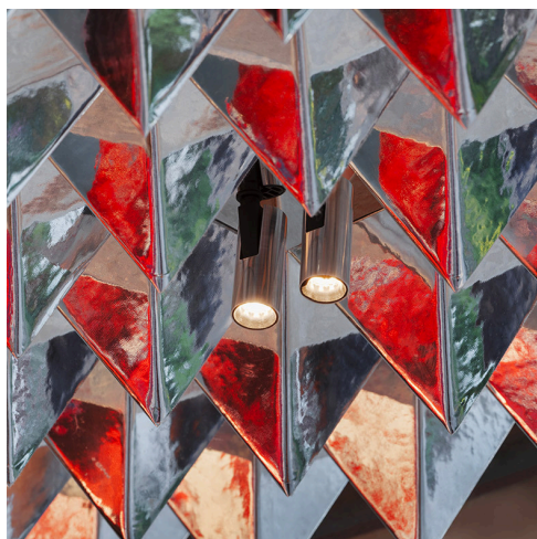
Vector Finitura Speciale - Carlotta de Bevilacqua