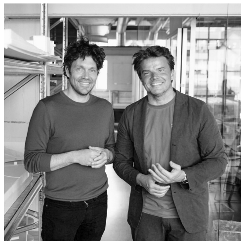
Bjarke Ingels & Jakob Lange

“Il nostro approccio al design cerca l'essenza più autentica di un'idea, per dare forma a oggetti senza tempo, pensati per durare e accompagnare generazioni.