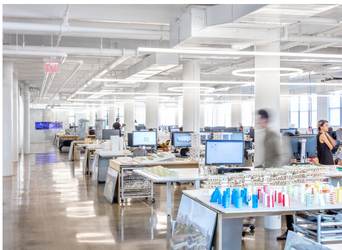
BIG Offices - NY

BIG – Bjarke Ingels Group è un gruppo internazionale di architetti e designer che opera nei campi dell'architettura, dell'urbanistica, della ricerca e dello sviluppo. Nato a Copenaghen, lo studio ha raggiunto una dimensione globale, con una presenza consolidata anche a New York, evolvendosi negli anni come una realtà sempre più multidisciplinare . L'approccio di BIG integra innovazione e competenza tecnica con una particolare sensibilità verso l'uso consapevole delle risorse, il controllo dei costi e la sostenibilità come valore strutturale del progetto. Su questi presupposti si fonda anche il rapporto decennale con Artemide , costruito attraverso un dialogo continuo fatto di ricerca, sperimentazione e visione condivisa.