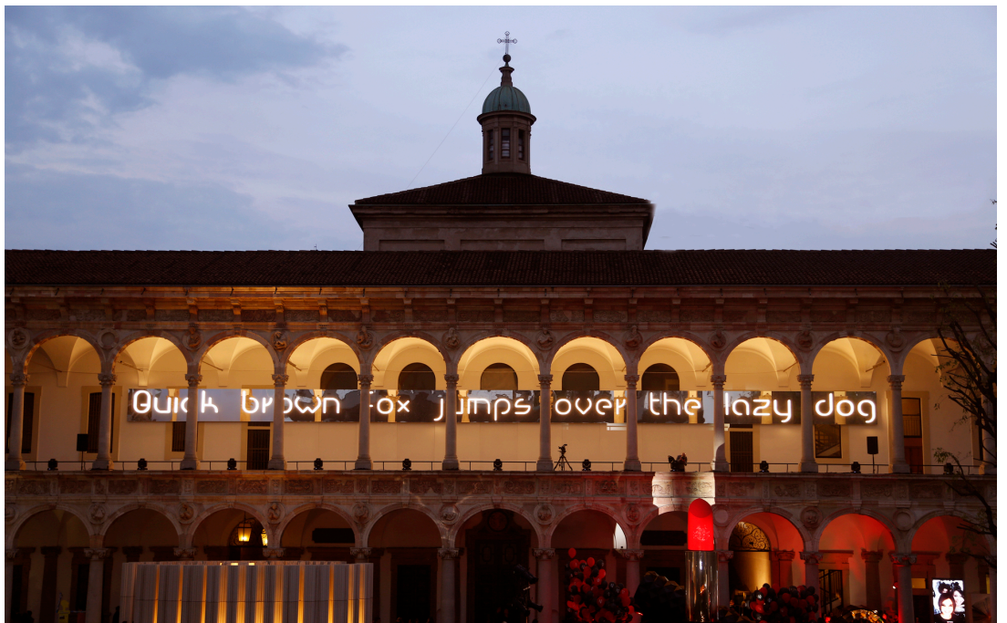
Alphabet of Light

INTERNI Material Immaterial, Università degli Studi di Milano, Italia, 2017