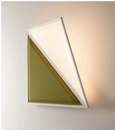
Flexia Wall, Mario Cucinella

➤ “Flexia è un gioco di percezioni tra il visibile, materico e colorato, e l’invisibile che diventa luce”