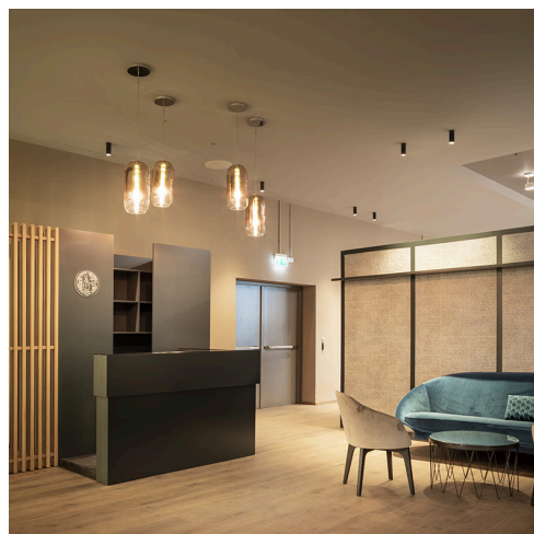
Gople - BIG | Vector Semirecessed - Carlotta de Bevilacqua