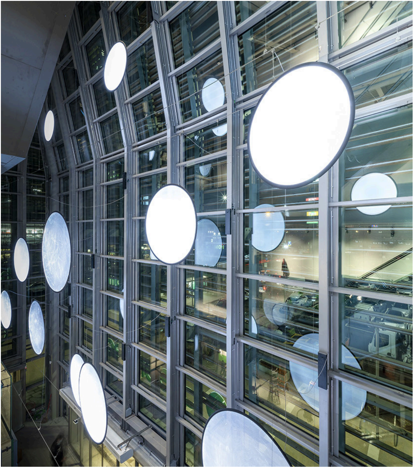
Discovery Vertical - Ernesto Gismondi

La superficie trasparente prende vita con una luce bianca o colorata, verde in onore di Green Pea, per una soluzione scenografica, che si intravede anche dall'esterno attraverso la facciata.