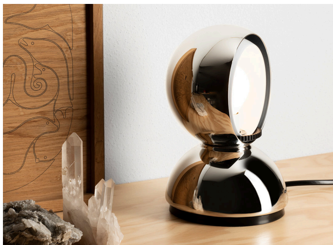
Eclisse PVD Mirror - Vico Magistretti