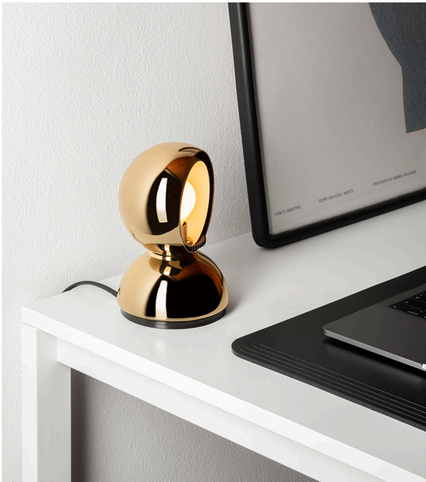
Eclisse PVD Ottone - Vico Magistretti

Le versioni PVD di Eclisse sono un perfetto esempio di come la ricerca Artemide su materiali, finiture e processi è fortemente orientata verso soluzioni sostenibili. Nella scelta progettuale l'impatto ambientale è una discriminante che si impone sul risultato estetico finale.