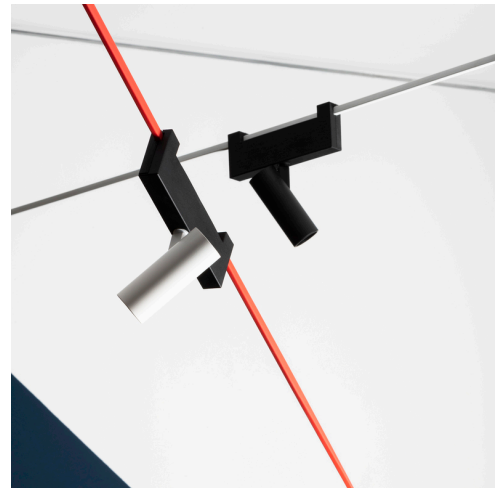
Funivia - Carlotta de Bevilacqua