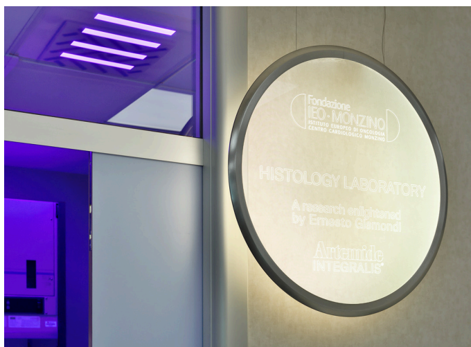
Discovery Special - Ernesto Gismondi | A.39 Diffused Pure Integralis - Carlotta de Bevilacqua

Sono stati illuminati due laboratori, quello di Microscopia e quello di Istologia, con particolare attenzione alle condizioni ambientali, attraverso la riduzione, grazie alla luce, dei microorganismi patogeni.