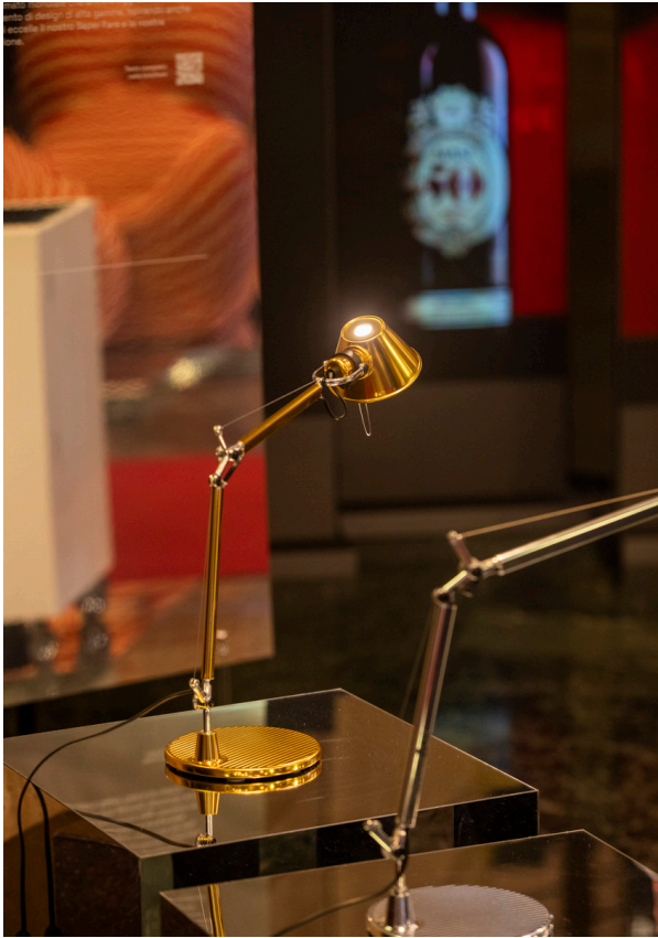
Tolomeo Micro Tavolo - Michele De Lucchi & Giancarlo Fassina