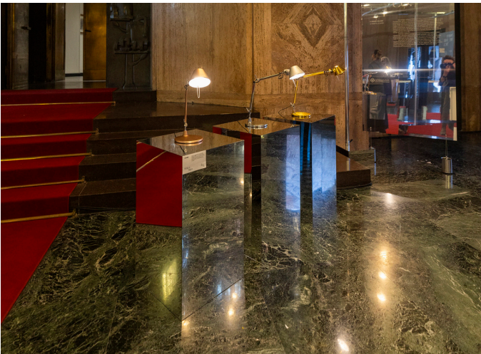
Tolomeo Micro Tavolo - Michele De Lucchi & Giancarlo Fassina

Attraverso due distinti percorsi narrativi, i visitatori hanno potuto immergersi nelle suggestioni della nostra manifattura: da un lato, ammirando le forme e le funzionalità dei nostri prodotti di design, dall'altro, esplorando i segreti della nostra produzione tramite coinvolgenti video immersivi.