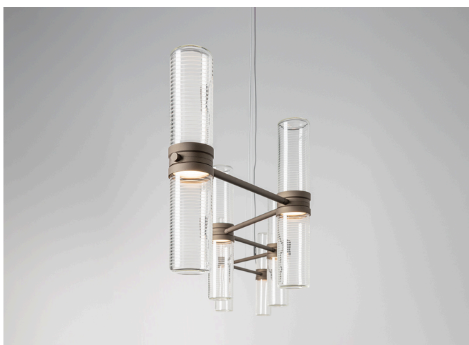
Zephyr Linear - Carlo Colombo

Zephyr è caratterizzato da un diffusore cilindrico in vetro soffiato a mano, lavorato con una texture ondolata che alterna strisce trasparenti e opaline. Questa raffinata tecnica non solo arricchisce esteticamente il diffusore, ma garantisce anche una diffusione della luce morbida e non abbagliante lungo l'intera superficie del cilindro, migliorando il comfort visivo.