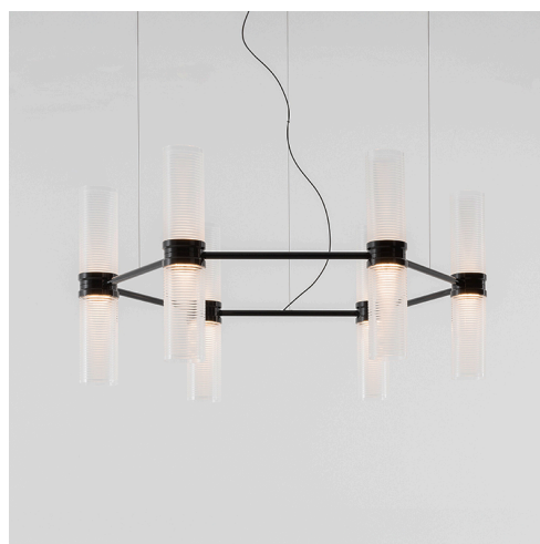
Zephyr Ring - Carlo Colombo