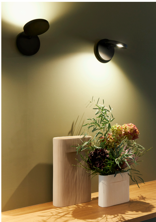
Demetra Parete - Naoto Fukasawa