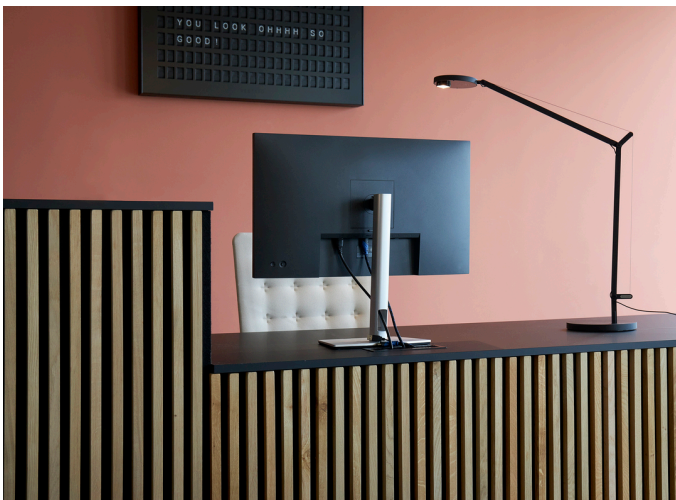
Demetra Professional Tavolo - Naoto Fukasawa