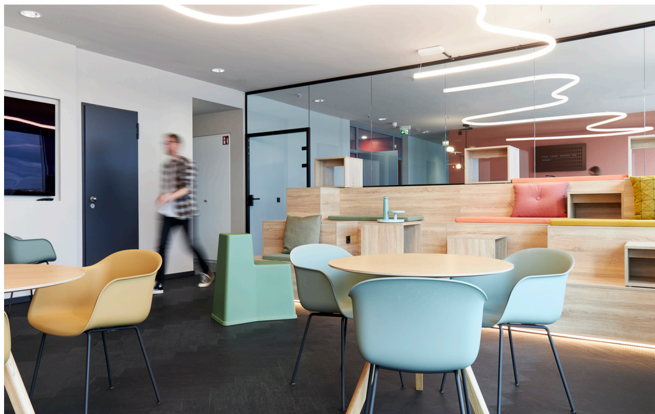
Alphabet of Light System - BIG Bjarke Ingels Group