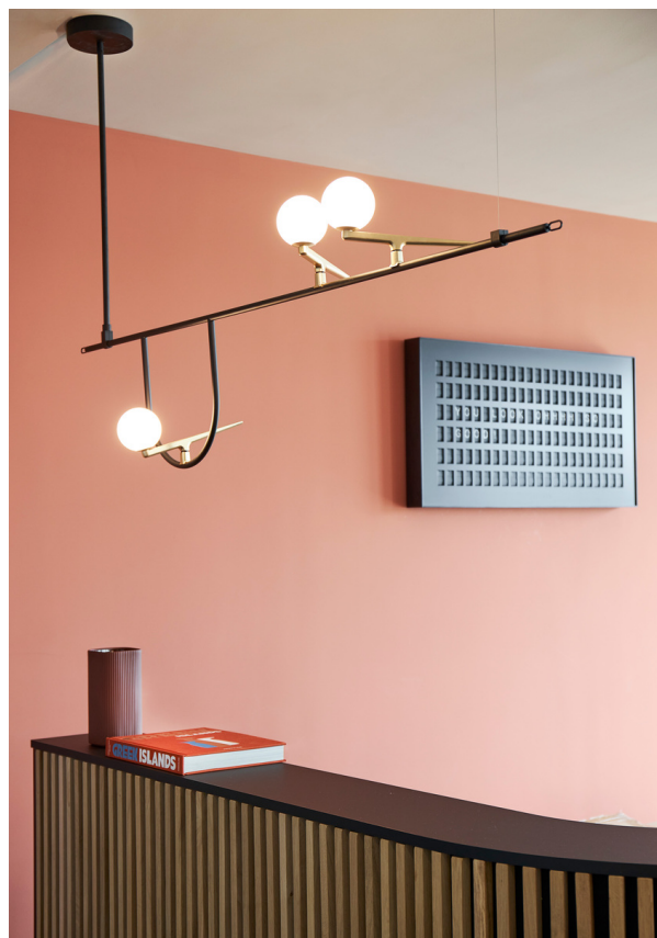
Yanzi Sospensione 1 - Neri&Hu