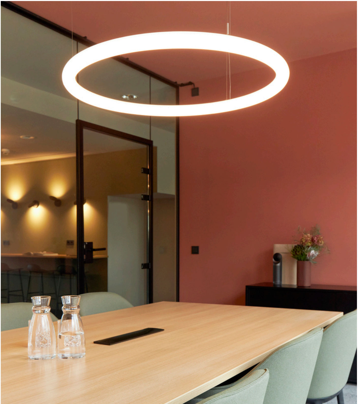
Alphabet of Light Circular - BIG Bjarke Ingels Group

Il marchio tedesco di lifestyle KAPTEN & SON, che opera come azienda globale con i suoi orologi, occhiali da sole e zaini, combina le sedi precedenti nella nuova sede di Colonia. In linea con lo slogan di KAPTEN & SON: "nati per l'avventura, esplorando il mondo", il design degli interni della nuova sede ricorda un suggestivo viaggio intorno al mondo. Ogni area dell'edificio per uffici ricorda una specifica regione del globo attraverso l'arredamento e l'illuminazione. Artemide è riuscita a creare una sinfonia luminosa che si fonde perfettamente con l'interior design circostante, amplificando l'esperienza di immergersi in luoghi suggestivi e affascinanti.