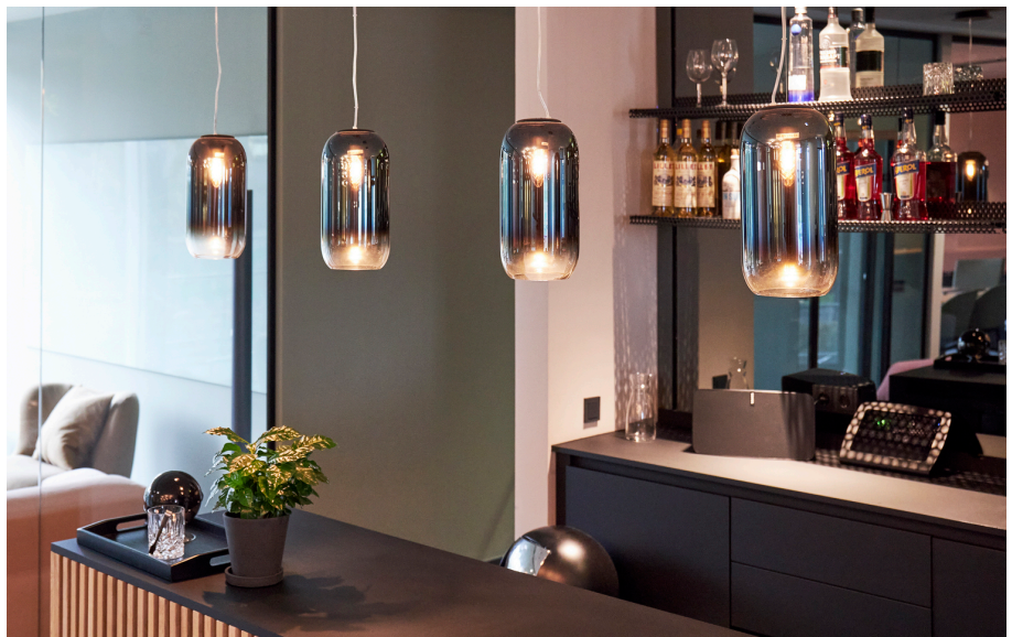
Gople Sospensione - BIG Bjarke Ingels Group