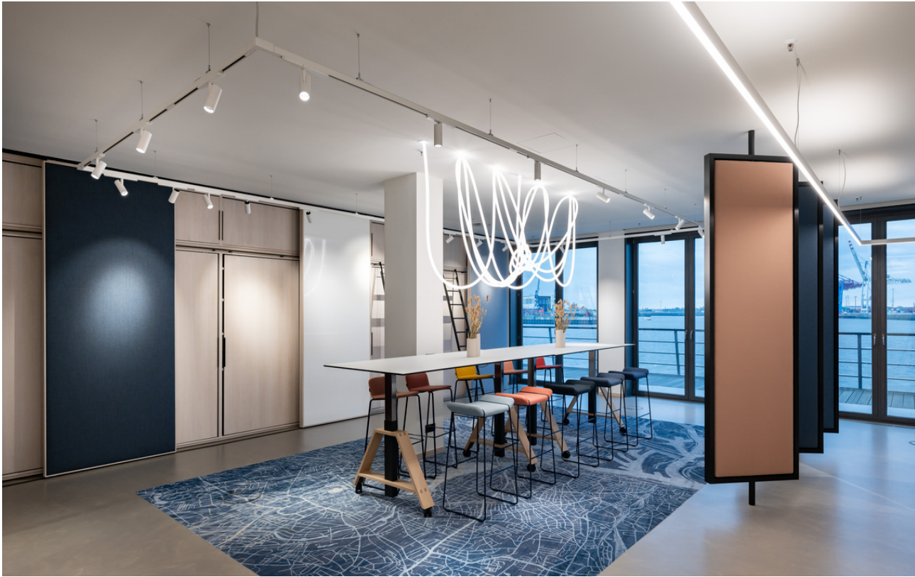
La Linea - BIG Bjarke Ingels Group