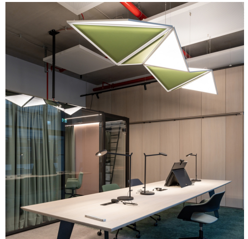
Flexia - Mario Cucinella | Demetra Tavolo - Naoto Fukasawa