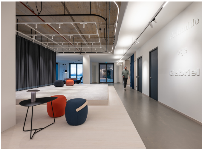
A.24 & Vector - Carlotta de Bevilacqua | Takku - Foster + Partners