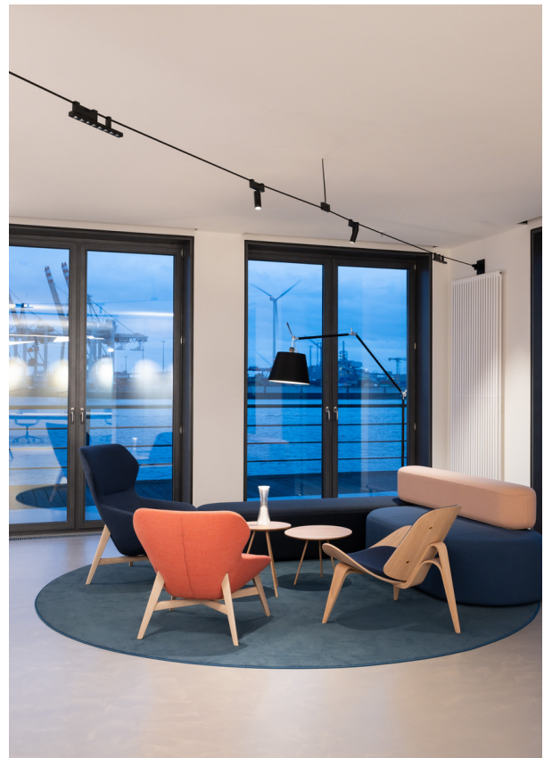
Funivia - Carlotta de Bevilacqua | Tolomeo Mega Terra - Michele De Lucchi & Giancarlo Piretti