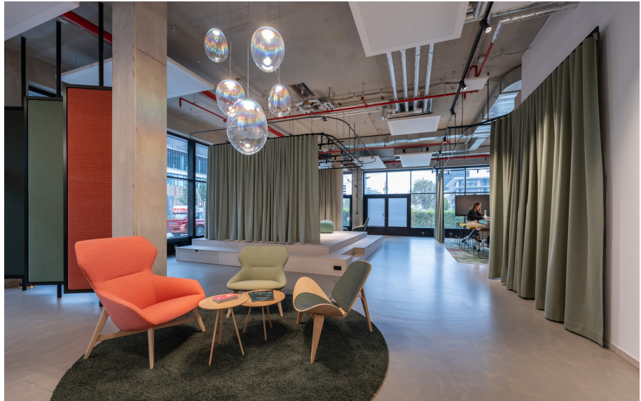
Stellar Nebula - BIG Bjarke Ingels Group