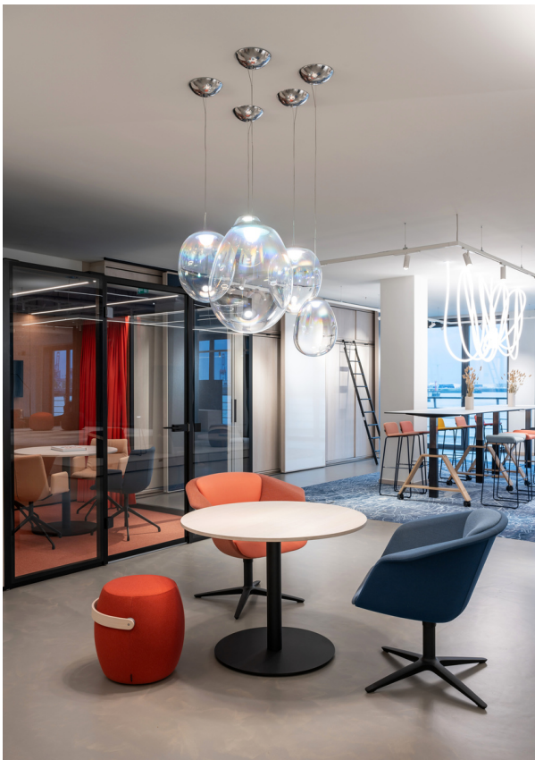
Stellar Nebula - BIG Bjarke Ingels Group