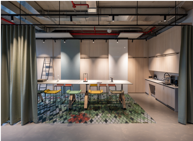
Vector Track - Carlotta de Bevilacqua