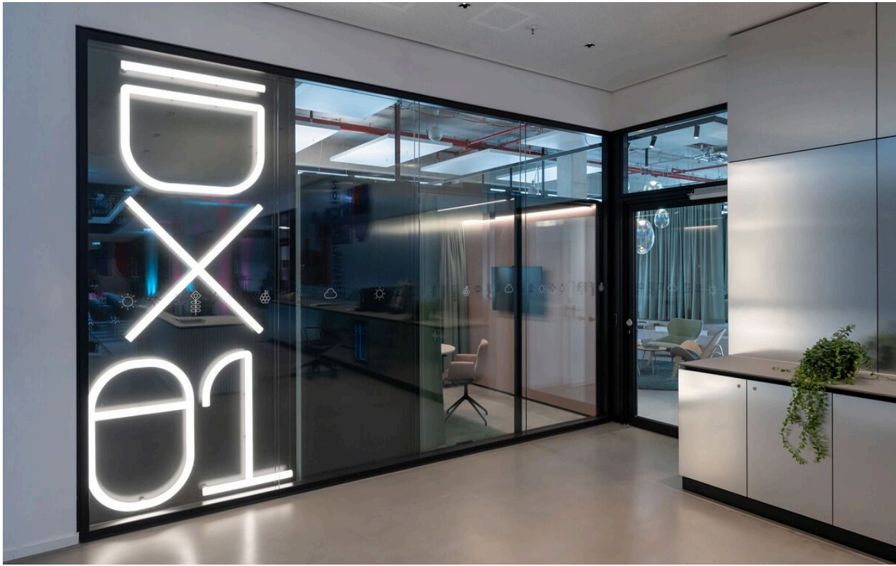
Alphabet of Light - BIG Bjarke Ingels Group