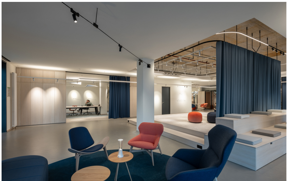
Funivia & Come Together - Carlotta de Bevilacqua