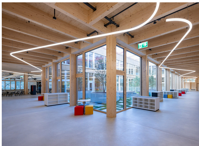
Alphabet of Light System - Bjarke Ingels Group

Alphabet of Light non solo illumina gli spazi della International School Rheintal, ma fa anche luce sulla dedizione della scuola a un futuro più verde e sostenibile.