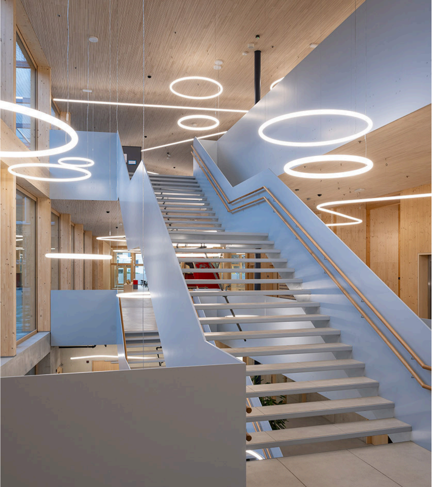
Alphabet of Light - Bjarke Ingels Group

Il concetto di sostenibilità è stato concretizzato attraverso la costruzione in puro legno di abete rosso regionale, l'impianto fotovoltaico, l'illuminazione ad alta efficienza energetica e il tetto verde.