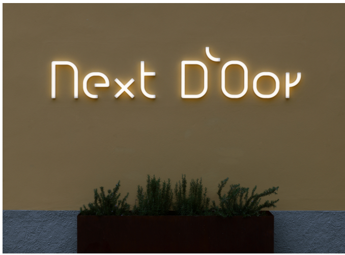
Alphabet of Light Letter Custom Outdoor - Bjarke Ingels Group