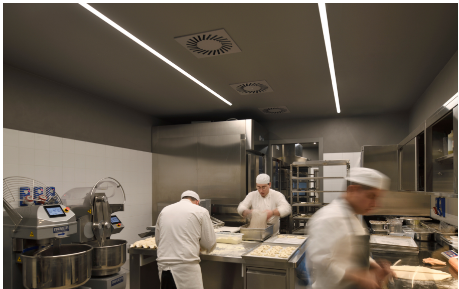
A.24 Emissione Diffusa - Carlotta de Bevilacqua

La partnership tra Artemide e Davide Oldani si manifesta in soluzioni luminose speciali, progettate per valorizzare l'ambiente e creare un'atmosfera unica che si sposa perfettamente con la filosofia culinaria di Oldani. È un connubio che va oltre il semplice lavoro di squadra, è la concretizzazione di un'idea condivisa, dove l'illuminazione diventa parte integrante dell'esperienza gastronomica.