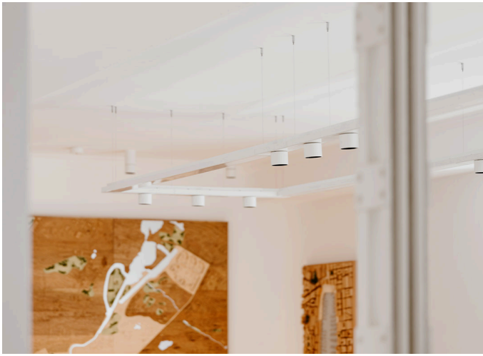
Hoy System - Foster + Partners Industrial Design