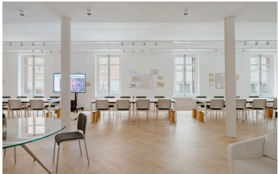
Hoy Spot & Hoy System - Foster + Partners Industrial Design