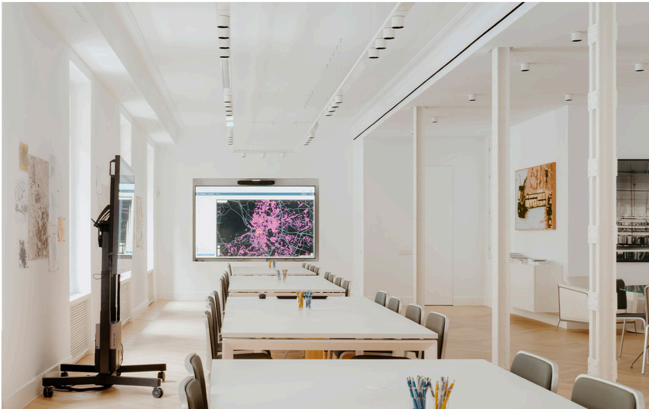
Hoy Spot & Hoy System - Foster + Partners Industrial Design

In questo contesto di eccellenza, è stato realizzato un progetto di illuminazione volto a valorizzare la sede, creando ambienti funzionali e accoglienti. La famiglia Hoy , frutto della collaborazione tra Artemide e lo studio Foster + Partners Industrial Design , armonizza luce e architettura, evidenziando sia le aree espositive sia le zone dedicate alla didattica e alla ricerca. Un intervento che unisce design e funzionalità, dimostrando come la luce possa sostenere creatività, ricerca e innovazione, migliorando l'esperienza quotidiana all'interno della fondazione.