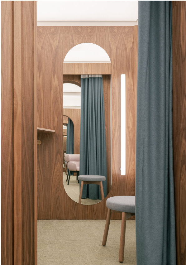
Alphabet of Light Linear - Bjarke Ingels Group