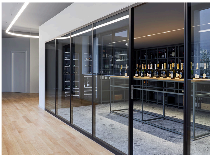
AoL System - BIG | A.24 Sharping - Carlotta de Bevilacqua