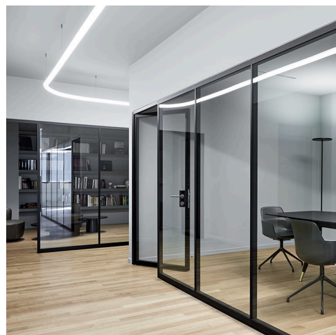
AoL System - BIG

Lo spazio è progettato per contenere e permettere lo svolgersi di diverse attività; all'interno di questo primo edificio infatti sono collocati ambienti di varia tipologia funzionale tra cui una biblioteca tematica, una cantina con l'esposizione di circa tremila bottiglie, una zona lounge, un'area bar, una cucina ed un piccolo spazio verde; il primo piano, più riservato, è invece dedicato agli uffici.