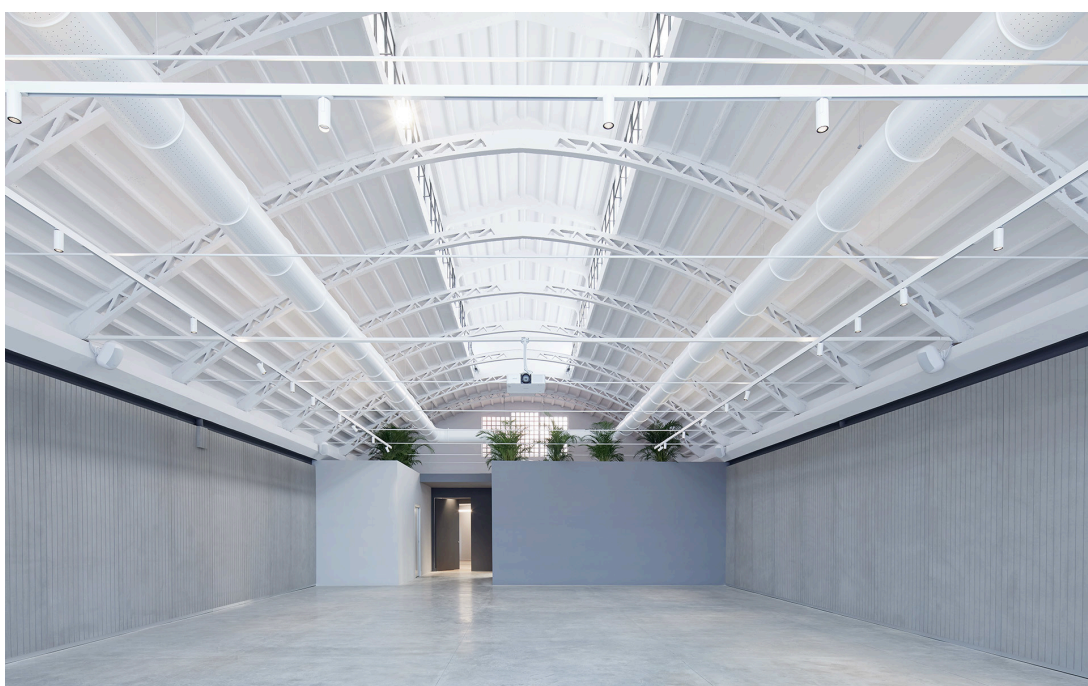
A.24 + Vector - Carlotta de Bevilacqua

Il secondo corpo di fabbrica, accessibile anche da via Plezzo, è invece un contenitore progettato per ospitare eventi di diversa natura culturale. Le funzioni di servizio di questo open space sono contenute in due volumi che si contrappongono su un corridoio di accesso.