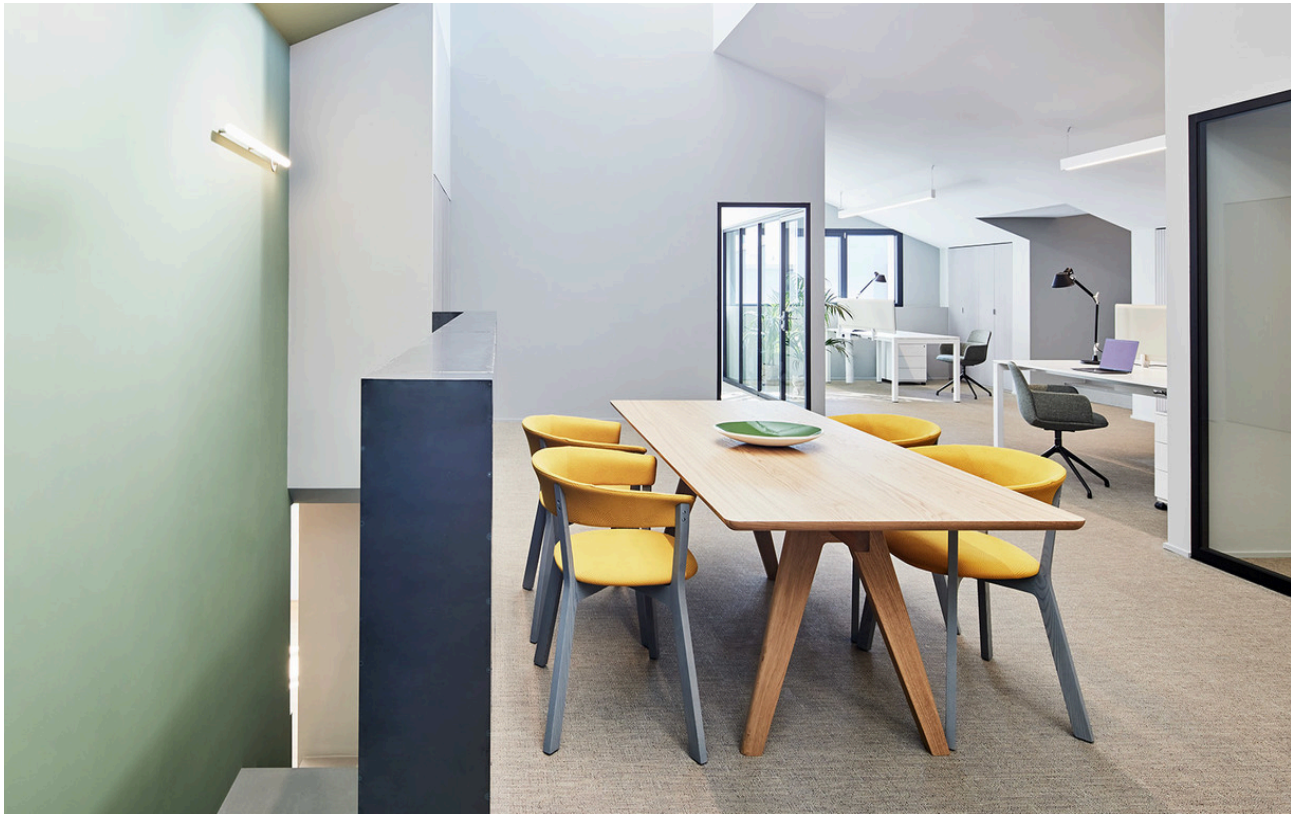
AoL Linear Wall - BIG | Tolomeo - Michele De Lucchi & Giancarlo Fassina | A.39 - Carlotta de Bevilacqua