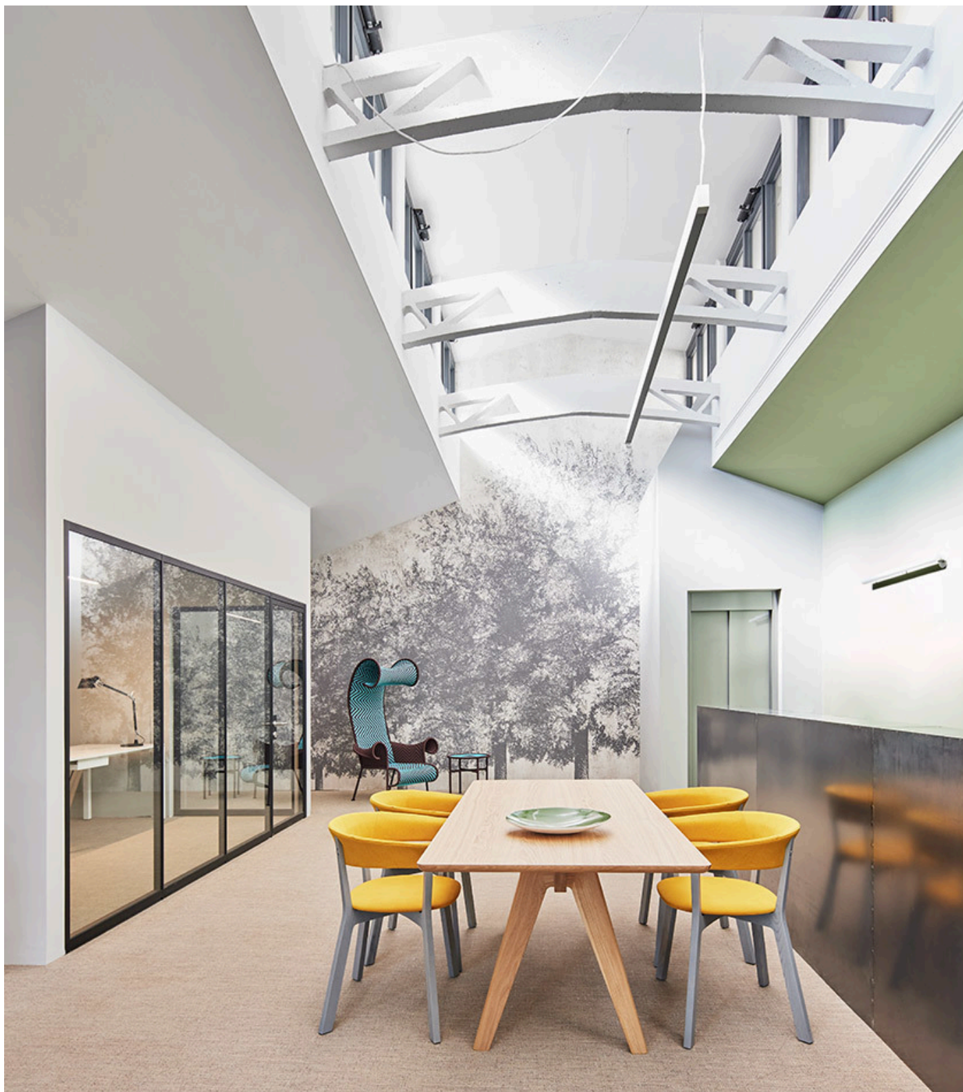
A.39 Diffused - Carlotta de Bevilacqua

A monte del progetto un cambio di prospettiva fondato su spazi e attrezzature di ultima generazione, con un occhio alla sostenibilità, sin dall'inizio uno dei pilastri del progetto.